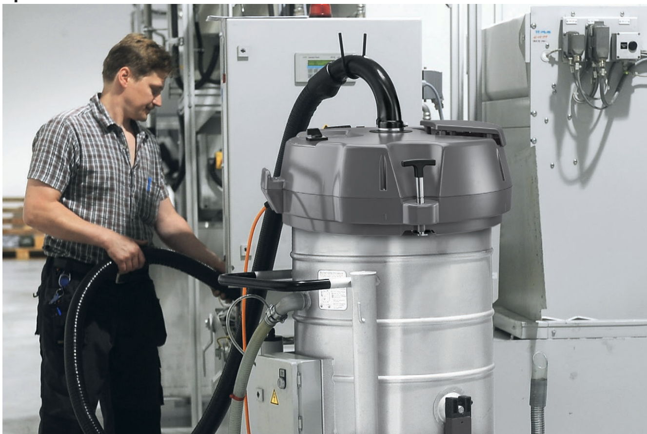
IVR-L 100/24-2 Me