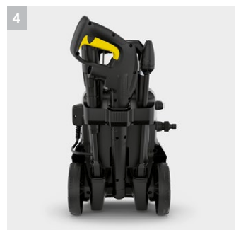
4 Интегрированное место для хранения принадлежностей