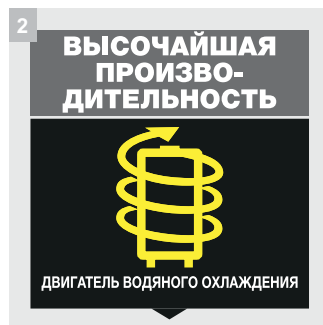
2 Мотор с водяным охлаждением