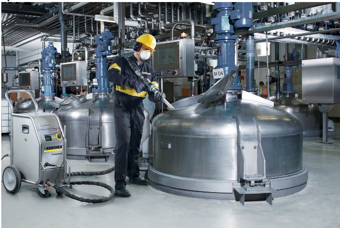
IB 7/40 Advanced