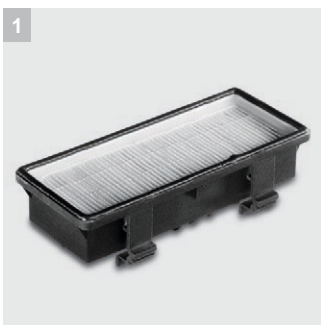
1 HEPA-фильтр для очистки выпускаемого воздуха

Уборка с соблюдением тишины. Пылесос T 12/1 отличается высокой силой всасывания в сочетании с низким уровнем шума и идеально подходит для уборки в местах, требующих соблюдения тишины, например, в гостиницах или офисах. Ножной выключатель и удобная ручка для переноски значительно облегчают работу.