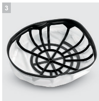
3 Корзина главного фильтра