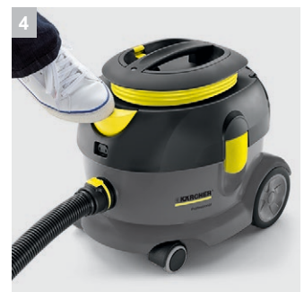
4 Педальный выключатель для дополнительного удобства